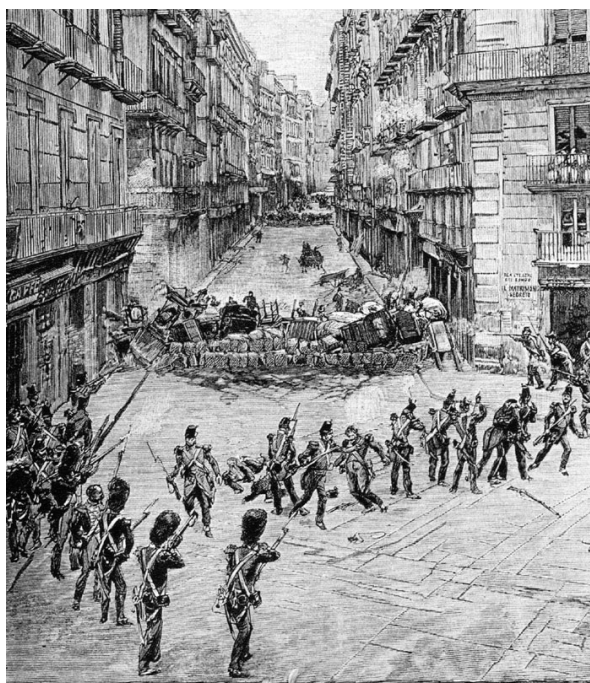
Napoli, 15 maggio 1948

Napoli, Villa Comunale, Casina Pompeiana Sabato, 19 gennaio 2019, ore 10-13