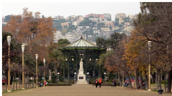
Napoli, Villa Comunale,